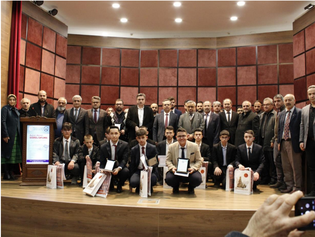
Ek 23. Kastamonu İli İmam Hatip Liseleri arası Kur'an'ı Güzel Okuma Yarışması.