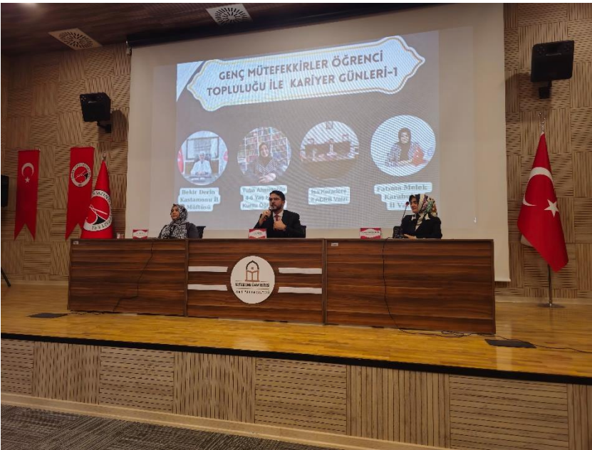
Ek 27. "Kariyer Günleri" kapsamında Diyanet İşleri Başkanlığı personellerinin fakültemiz öğrencileri ile bir araya gelip meslekleri hakkında bilgilendirmelerde bulunmaları.