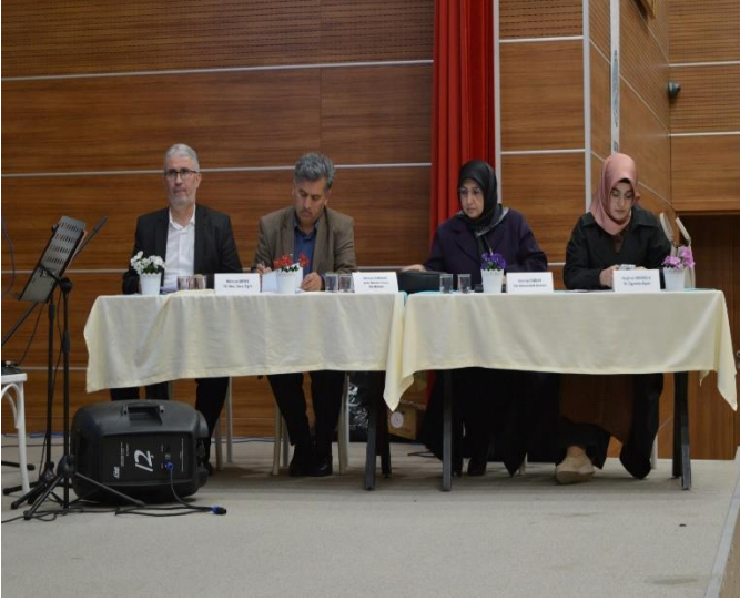
Ek 5. Kırk Hadis Ezberleme Yarışması.