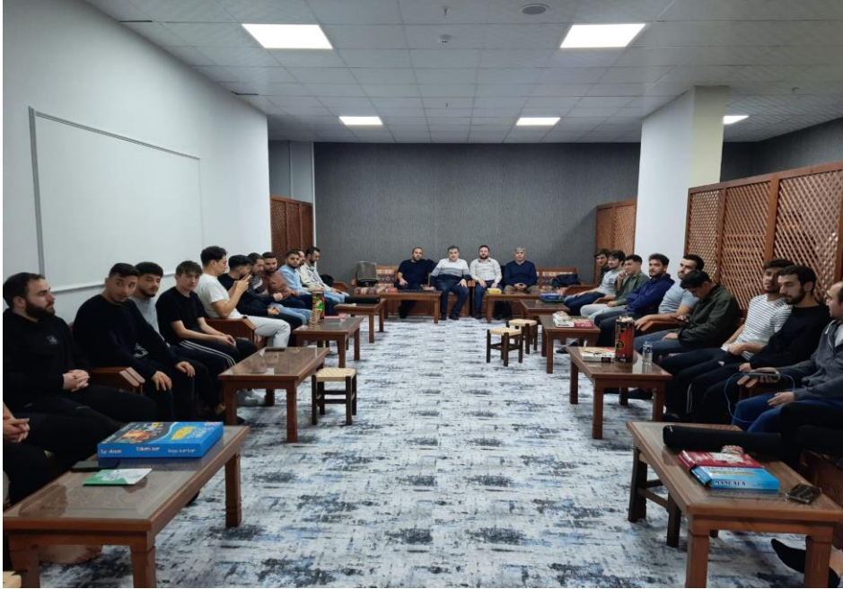
Ek 21. Öğrenci- Akademisyen Buluşmaları, Şeyh Şaban-ı Veli Erkek Öğrenci Yurdu.