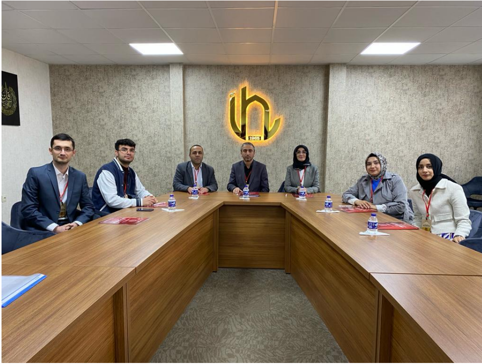
Ek 25. Kastamonu İl Millî Eğitim Müdürlüğü koordinesinde "Türkiye Yüzyılı Din Öğretimi Kastamonu İl Çalıştayı" katılan öğretim üyeleri ve öğrencilerimiz.