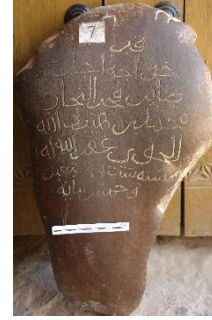
Resim 2: Hoca Ecell Sâbir Fahr-üt-Tüccâr Muhammed ibn Heybetillah el-Hoyî kitabesinin çizimi ve orijinal görünümü (1182/83).

Karahanlı coğrafyasında bundan başka "hoca" unvanını taşıyan Hasan Danişment ibn Hoca Sadr , Ahmet ibn Hocaş gibi itibarlı kimselerin yerli halk arasında mühim rol oynadıkları bilinmektedir.