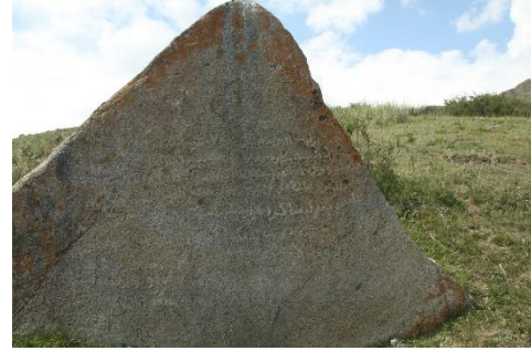
Resim 5: Isık-Göl, Jer-Üy, Yesevî alıntılarında öğüt sözler (Belek 2012)

Konu ile ilgili sonuç olarak belirtilmesi gereken en önemli husus, Türkistan coğrafyasındaki Yesevîliği “koco”, “koca”, “hoca” saygı gösterileri altında tarihi süreç içerisinde buldukları coğrafya ve itibar gördüğü topluluklara göre farklı bir ideal altında târif edilse de efendi , muallim , müderris , ağa , çelebi , ata gibi halkı yöneten kimselere ve Hoca Ahmed Yesevî gibi büyük âlimlere verilen bir isim olmuştur.