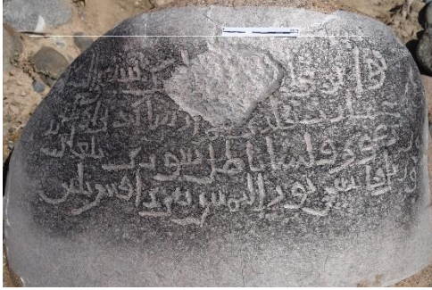
Resim 4: Isık-Göl, Tört-Kül, Yesevî alıntılarında öğüt sözler (Belek 2010)

Yesevîlik veya Hocagân yolu, Karahanlı konar-göçer topluluklarında İslamiyetin benimsenmesi ve yeterince bilgiye ulaştırılmasında önemli derecede rol oynamıştır. Karahanlı toprakları içinde kalan Tanrı Dağları, Yedi-Su ve uçsuz bucaksız bozkırda yaşayan göçebe topluluklarında İslamiyeti, bozkır inanışlarıyla bütünleştirerek yayılmasında çok derecede başarılı olmuşlardır. Bunların örneklerini Tanrı Dağlarında bulunan kaya yazıtlarından, mezar taşlarından ve diğer kitabelerden görebiliriz (Resim 4-5).