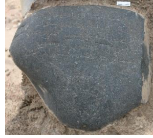
Resim 1: Ebu Reşid Kayıg Kitabesinin çizimi ve orijinal görünümü